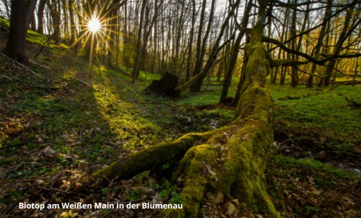
Biotop am Weißen Main in der Blumenau